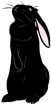
完成見本 (くろいうさぎ)