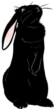
完成見本(くろいうさぎ)